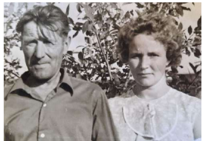
Прадед со своей старшей дочерью

Но даже после такого ужасного опыта, прадед еще участвовал в военных действиях под Гродно, где был ранен. И уже после войны, когда рассказывал близким об этих ужасных событиях, сквозь слезы добавлял: «Чтоб только вы, дети, никогда с подобным не сталкивались».