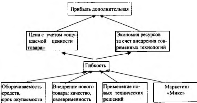
Рис.1. Анализ гибкости как показателя эффективности работы предприятия

Разработана методика расчета эффективности за счет гибкости. При этом под гибкостью понимается способность предприятия быстро реагировать на изменения внешней среды, приобретать новые черты, изменять функции, структуру, технологию и другие внутренние факторы. Данный показатель представляет собой количество нововведений, в том числе обновление ассортимента за определенный временной период. Дополнительная прибыль, полученная в результате гибкости, представляет собой эффект хозяйствования. Анализ гибкости представлен на рис 1.