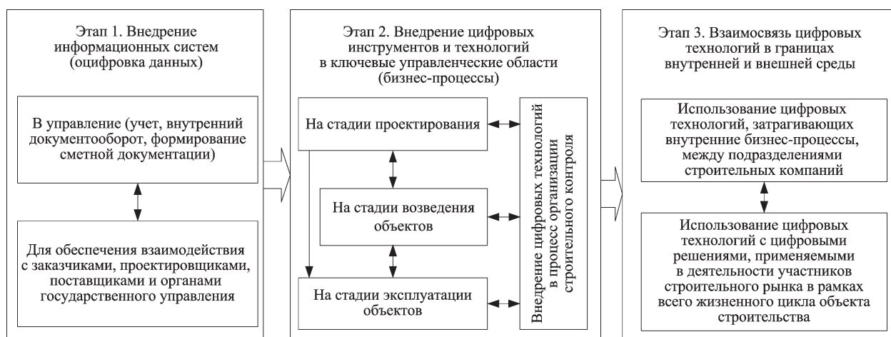
Рис. 1. Процесс цифровизации отечественной строительной отрасли с учетом жизненного цикла объектов строительства