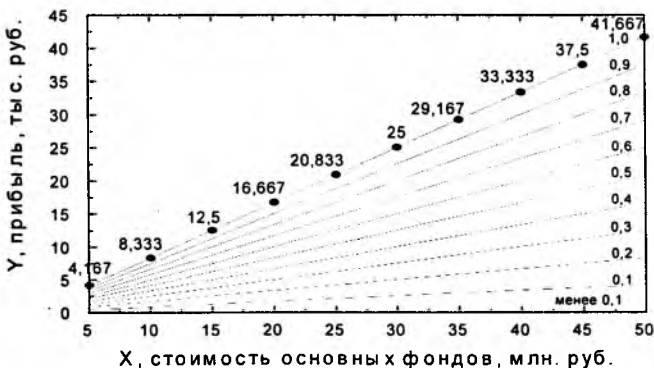
Разработанная система дифференцированных ставок по налогу на недвижимость в зависимости от соотношения облагаемой стоимости основных фондов и прибыли

Кроме того, соискателем разработана принципиально новая система ставок для расчета налога на недвижимость – "гибкая система ставок". В основу этой системы положен принцип дифференцирования предприятий по величине соотношения двух экономических показателей их деятельности: облагаемой стоимости имущества и заработанной прибыли. Эта дифференцированность основывается на достаточности прибыли для погашения обязательств перед бюджетом по налогу на недвижимость. Разработанная система позволит исключить один из факторов убыточности предприятия и не влечет уменьшения объема средств, поступающих в бюджет, так как одним из принципов гибкой системы ставок является временная отсрочка платежа. Принцип применения разработанной системы представлен на рис.