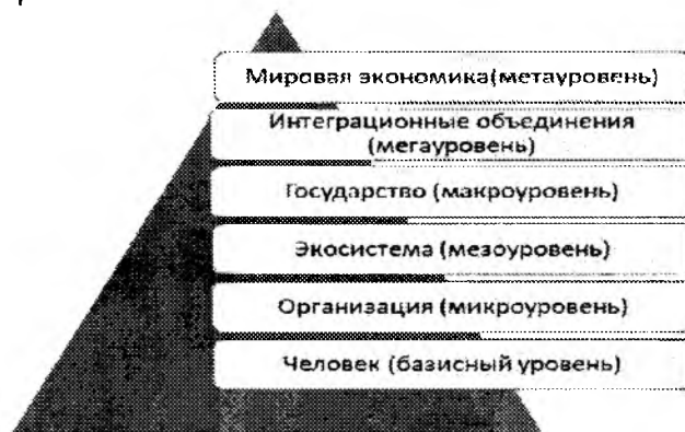
Рисунок 2. – Уровни субъектов финансового потенциала