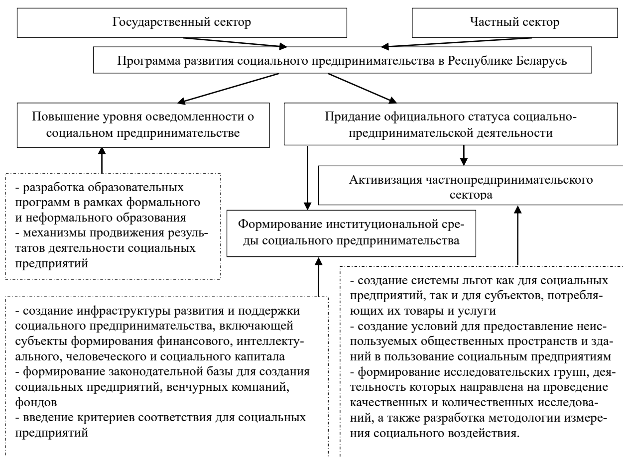
Рисунок 2 – Механизм государственного регулирования социального предпринимательства

В дополнение к разработанной экономической системе государственного регулирования определен механизм государственного регулирования социального предпринимательства. Реализация предложенного механизма предполагает разработку и принятие Программы развития социального предпринимательства в Республике Беларусь, действие которой направлено на объединение ресурсов государственного и частного секторов для достижения поставленных целей и решения задач, а именно придания официального статуса социально-предпринимательской деятельности, формирования институциональной среды СП, повышения уровня осведомленности о СП. Механизм государственного регулирования представлен на рисунке 2.