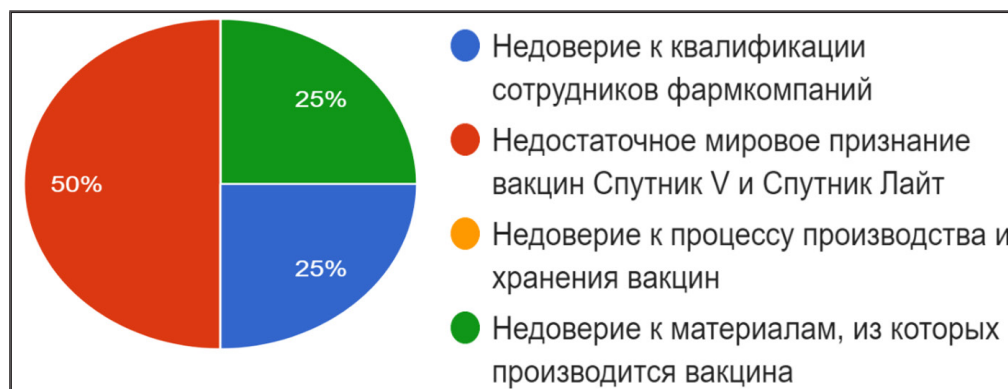
Рис. 2. Причины недоверия к фармацевтическим компаниям

Согласно данным опроса недоверие к фармацевтическим компаниям заключается в недостаточном мировом признании «Спутника» (по мнению 60 % опрошенных), а также в недоверии к сотрудникам компаний и качеству материалов (по 25 % опрошенных соответственно) (рис. 2).