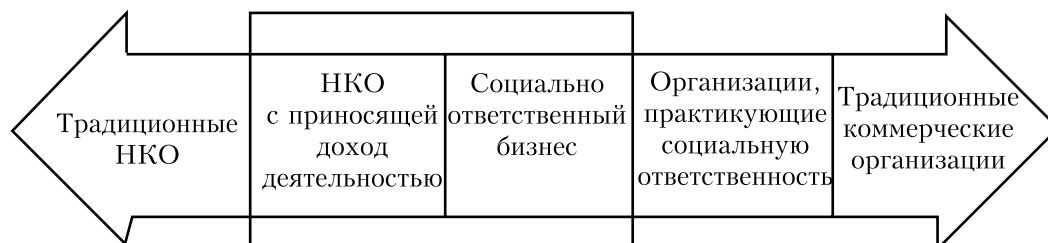
Рис. 2. Распределение гибридных организаций

ную ценность, но основными их мотивами являются получение прибыли и ее распределение. С левой — некоммерческие организации, занимающиеся коммерческой деятельностью лишь постольку, поскольку она необходима для их функционирования.